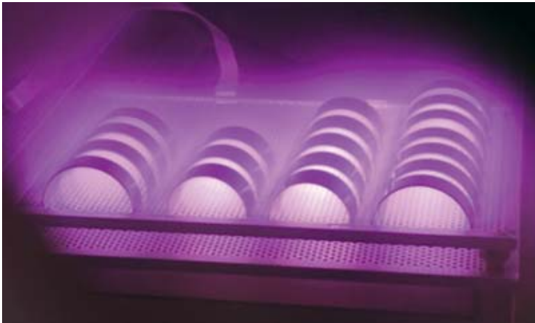
Erst das Plasmaverfahren schafft LABS-Konformität.