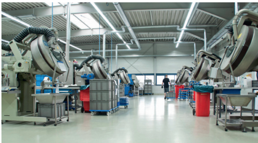
Elastomer-Dichtungen werden in speziellen Maschinen mit einer hauchdünnen, hochelastischen und umweltfreundlichen Gleitlackschicht auf Wasserbasis beschichtet. Damit lässt sich die Reibung um durchschnittlich 50 Prozent reduzieren.

Trotz aller Möglichkeiten, die das Beschichten herkömmlichen Dichtungen eröffnet, bleiben viele Einflussfaktoren, die das Ergebnis erschweren können. Die gilt es zu beherrschen. Das fängt bei der Werkstoffvielfalt mit unterschiedlichen Arten an. Die Unternehmen müssen sich mit NBR, HNBR, AEM, FKM, EPDM, VMQ, FVMQ oder Gummi-Metallverbindungen auseinandersetzen. Hinzu kommen Compounds in ihrer Zusammensetzung aus natürlichem oder synthetischem Kautschuk mit Füllstoffen aus Ruß oder Mineralien, mit Weichmachern, seien es Öle oder synthetische Produkte. Darüber hinaus beeinflussen Vernetzungsmittel wie Schwefel etc., Vulkanisationsbe-