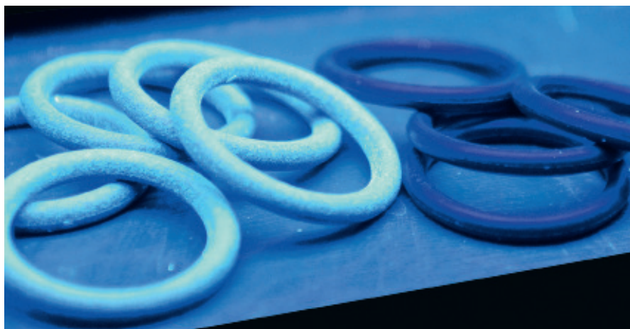
Zahlreiche Prüfungen schließen sich nach dem Beschichtungsprozess an und geben den Anwendern Sicherheit über den ordnungsgemäßen Zustand der Dichtungen.

gleichskarten und Rückstellmustern abgeglichen. In speziellen Anordnungen werden Drehmomentbelastung, Zug- und Druckkräfte wie sie beim Fügen und Stecken der Produkte vorkommen, simuliert, um die mit dem Kunden vereinbarte Qualität der Beschichtung zu testen. Bei Beschichtungen mit UV-Indikatoren folgt eine Prüfung der Gleitlackbeschichtung durch UV-Licht. Und schließlich werden physikalische und chemische Prüfungen durchgeführt,